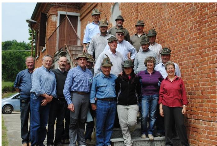
Gli Alpini di Salce con gli amici di San Damiano d'Asti

ci ha potuto far capire quanto gli alpini siano amati dalla popolazione piemontese. Fra bande e manifestazioni le strade erano gremite già di prima mattina e siamo riusciti a salire sui mezzi pubblici, stracolmi, non senza qualche difficoltà.