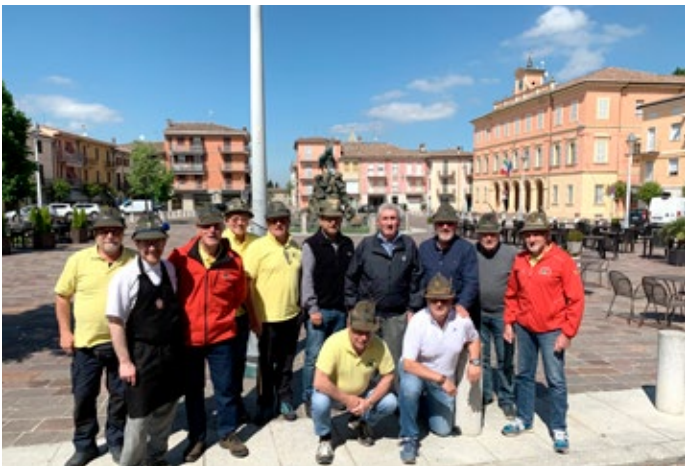
Foto ricordo in piazza ad Agazzano.