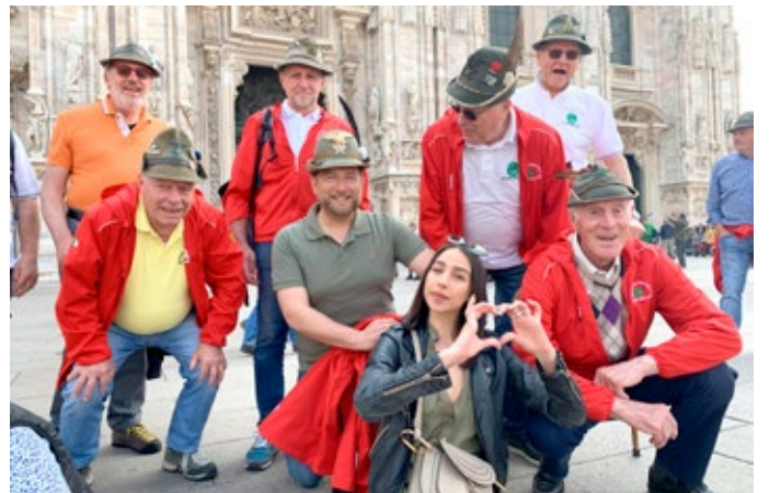
I nostri "Vecchi" nel cuore delle turiste.