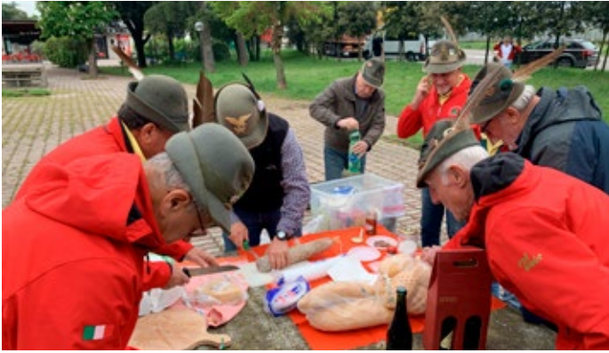
La tradizionale prima sosta in autostrada.