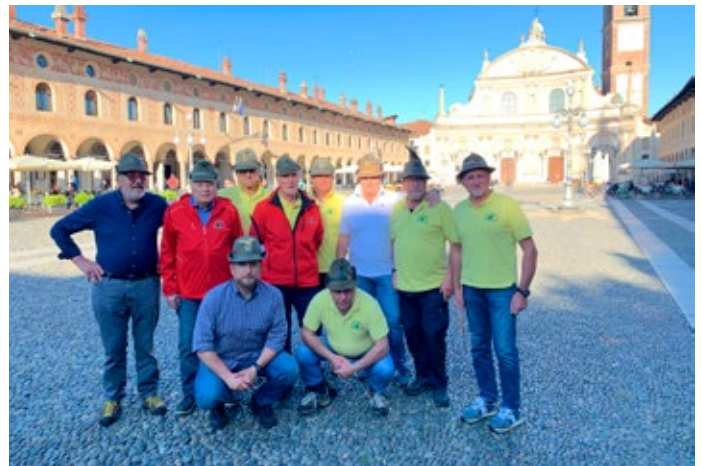
La splendida piazza di Vigevano.