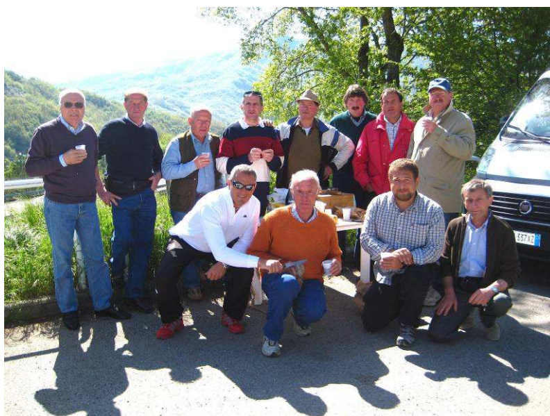
Sempre affiatati e in armonia, ecco i 12 partecipanti + 1 (Ennio Pavei il fotografo) all'Adunata 2009, in una sosta lungo la strada per Latina