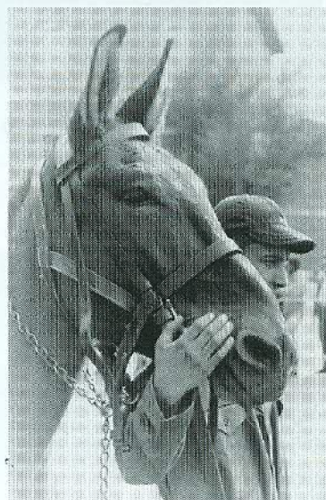
"Il cavallo dalle orecchie lunghe"

Hanno assicurato l'appoggio le Province di Treviso, Vicenza, Verona, Padova, Mantova, Modena, Lucca, Siena, Firenze, Viterbo e Roma, con il beneplacito dello Stato della Città del Vaticano e del Comune di Roma.