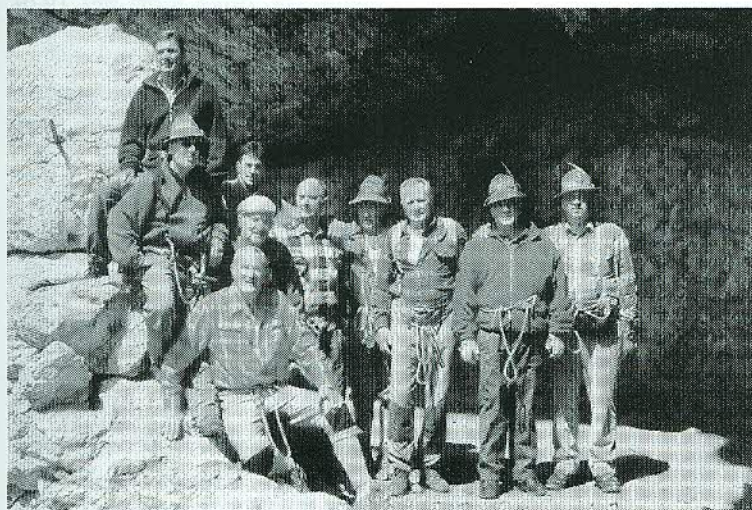
Gallerie del Lagazui: dieci soci del Gruppo ANA Belluno-Città in escursione con guida il 17 e 18 luglio 1999.

Ancora un impegno degli alpini pontalpini – Dal giornale "L'Amico del Popolo" abbiamo ripreso la notizia di una esercitazione di protezione civile effettuata dai volontari del Gruppo di Ponte nelle Alpi-Soverzene e finalizzata alla pulizia del greto del fiume Piave. "Cento sacchi di rifiuti nocivi, 40 quintali di immondizia ordinaria, tanti copertoni di vetture e camion, sei mezzi del Comune di Ponte nelle Alpi, ma soprattutto 60 uomini della protezione civile impegnati sul campo.