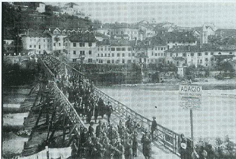
Ponte provvisorio in legno sul Piave: inaugurato nel 1920, travolto da una piena nel 1926.

Dalla tabella posta sulla testata sinistra del fiume si rileva: "ADAGIO - procedere a passo d'uomo - MUNICIPIO DI BELLUNO - E' vietato il transito ai veicoli di peso complessivo superiore ai 70 quintali". Dalla pubblicazione "Borgo Piave" sopra citata rileviamo invece che il ponte aveva una portata di 150 quintali.