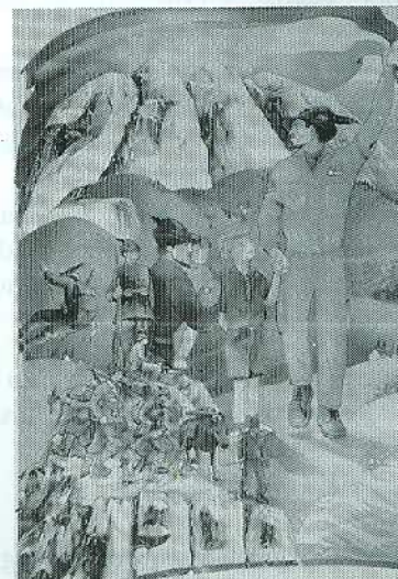
Calendario Alpino 2000: "Dalle patrie battaglie alla protezione civile" (si notino le rocce in basso 1900 e quelle in alto 2000)