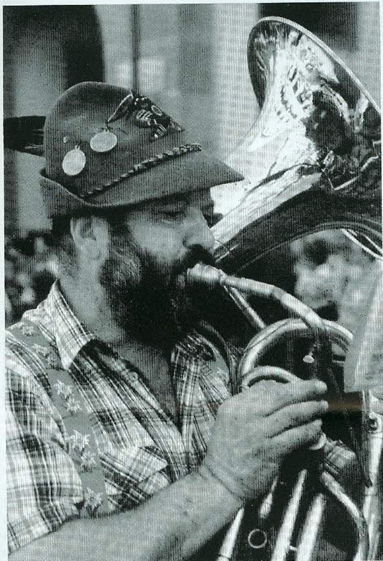
Alpini da tanto tempo, alpini per sempre, al suono del "Trentatre" salutiamo il nuovo anno!

Nei reparti alpini ora non si canta più, o molto meno di una volta, quando il canto accompagnava alpini e artiglieri nelle escursioni, nelle serate di riposo, perfino, sembra inverosimile, in guerra. E quando un commilitone aveva l'umore nero e le ore buie, una pacca sulla spalla e poi: va là, canta che ti passa!