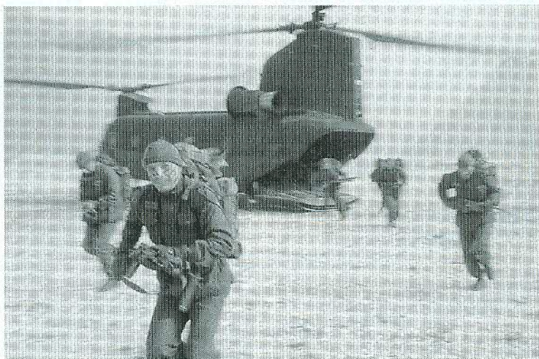
Cavazzo Carnico: sbarco da elicotteri

Abbiamo stretto la mano a tanti ufficiali, assurti poi agli alti vertici dei comandi militari, tanti amici in congedo o in pensione, e qualche "taiut" ha aiutato a rimembrare episodi belli o buffi o di fatiche di una naia ormai lontana, ma in fondo bella perchè segnava i nostri vent'anni.