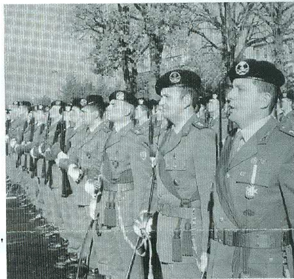
"Onori al Comandante..." (da Rivista Militare)