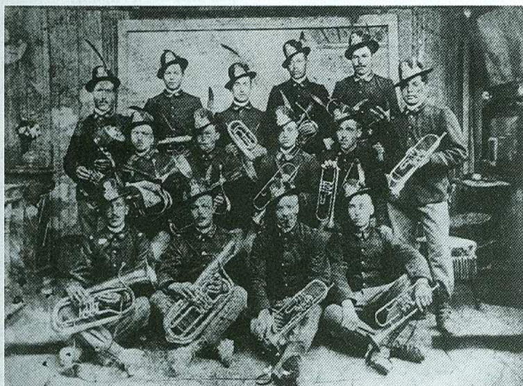
La prima banda del Btg. Pieve di Cadore del 7° Rgt. Alpini, a fine '800

Il titolo di questo articolo è volutamente provocatorio e forse nessuno risponderà alle no-