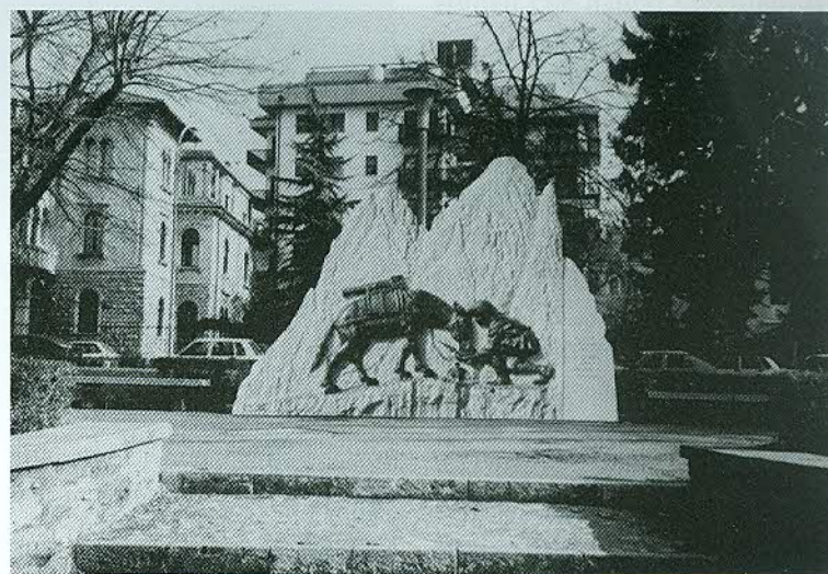
Belluno alpina: ci resta un monumento!

E infatti attualmente a quel reggimento sono in forza ben 1500 reclute, di cui una metà destinata alla Julia e metà alla Taurinense e non avendo la piazza d'armi della Caserma Salsa una capienza sufficiente a contenere tutte quelle reclute e 3000 familiari e amici nel dì del giuramento, si fanno due cerimonie: una a Belluno per i "torinesi" e una in seguito in