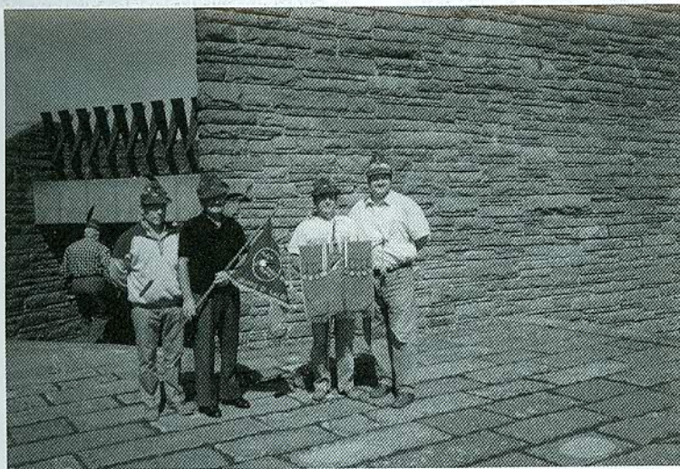
Rappresentanza di Salce a Firenzuola 1997