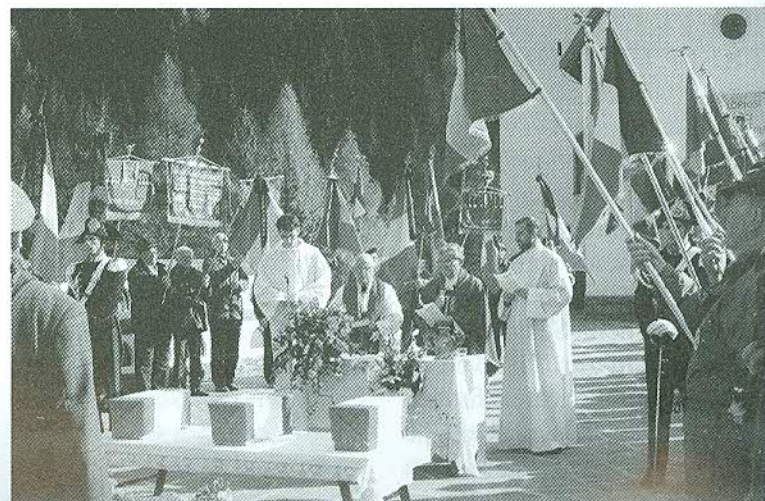
Salesei: onori alle urne dei tre fanti