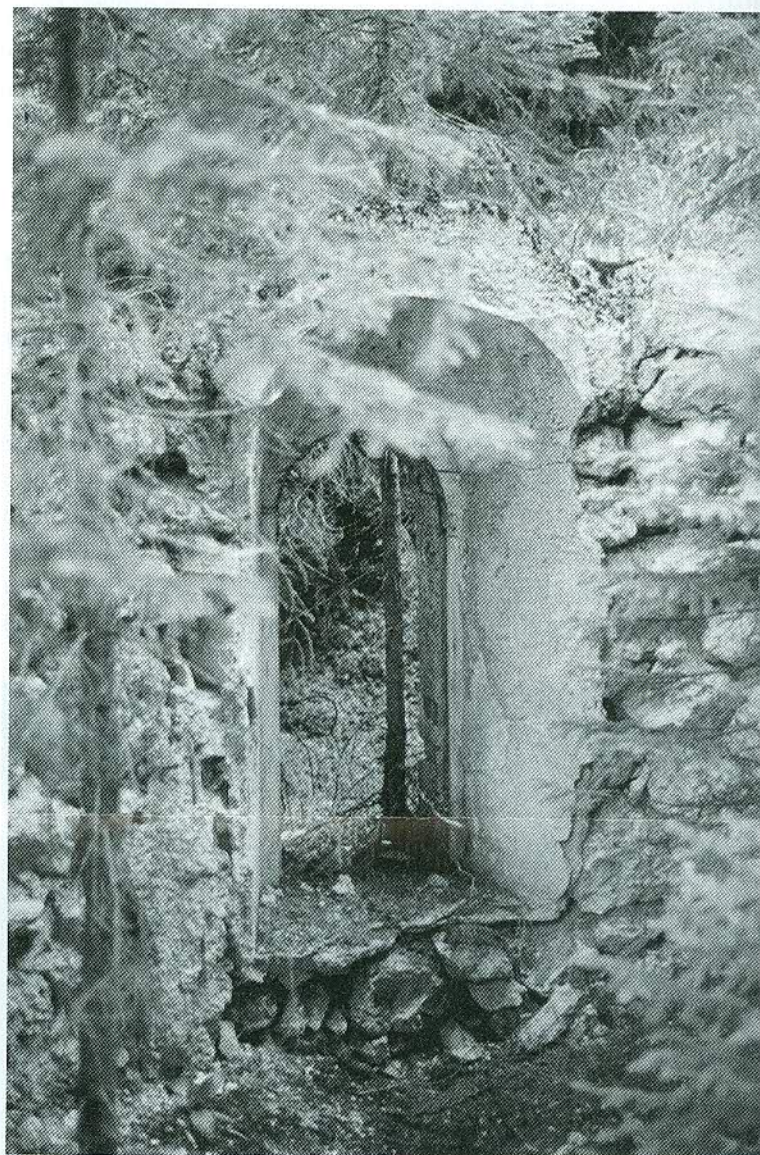
Resti di una chiesetta a "Prè de Piera" sotto il Sass de Stria. Da qui partirono le nappine rosse del Val Chisone per l'ardita ascesa.

La selletta vista da lontano appare limitata come superficie e soggiacente all'inevitabile controllo dalla guglia superiore della vetta. Non è così. Un avvallamento naturale fra due cocuzzoli rocciosi permetteva una sicura permanenza, al riparo anche di aguzzi macigni dispo-