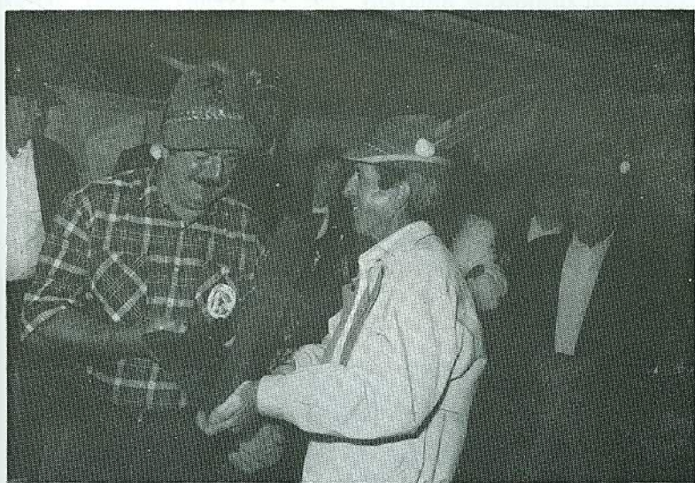
Scambio di doni fra Borsoi e La Spezia