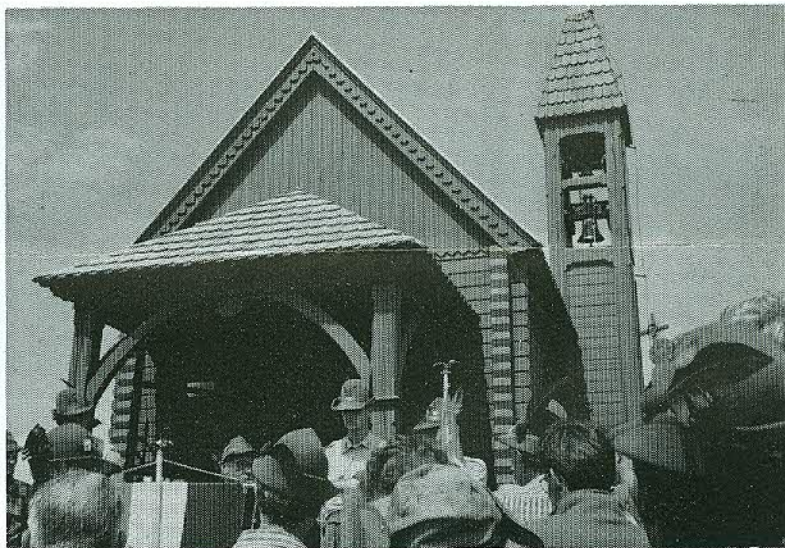
La S. Messa del 2 agosto sul Col di Lana

E' quasi una riunione di famiglia, veramente un clima di paese di montagna, lontani dai rumori, in amicizia, fra vecchi amici, perché negli anni siamo quasi sempre quelli, gli abituarissimi della festa. Un frugale rancio alla paesana sotto gli abeti, qualche timido canto, forse una fisarmonica e poi tutti a casa.