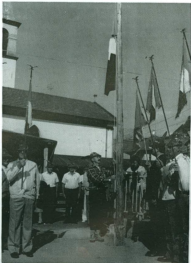
A Borsoi: l'alzabandiera sulla piazza del paese

Tutto bello, anche il tempo, tutto filato nel suo verso giusto, ottima l'organizzazione, ma possiamo senz'altro af-