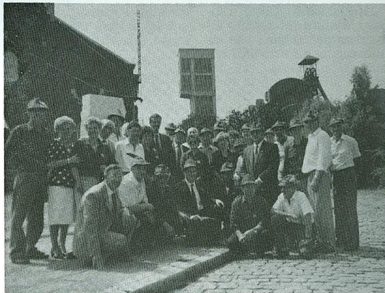
I «magnifici sette» di Tisoi, con gli alpini belgi e signore davanti alla miniera; il console di Charleroi sotto a sin.

263 minatori sono imprigionati ad una profondità di 1035 metri, da un incendio scoppiato, sembra, per un banale corto circuito. Giorni, settimane, mesi interi sono durati i soccorsi e gli aiuti, dapprima con la speranza di poter salvare quelle vite umane, ma alla fine altro non sono serviti se non per poter riportare in superficie quanto rimaneva dei corpi straziati dei poveri minatori.