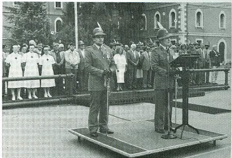
Al «cambio» parla Neri