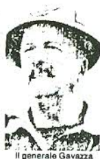
Il generale Gavazza

In questi giorni, solo polemiche assurde e strumentali