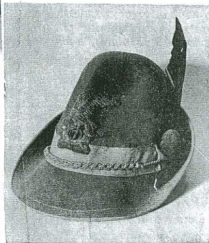
Il cappello alpino del «vecio»

Ecco perché vorremmo che questo articolo non rimanesse lettera morta.