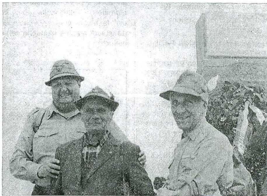
Boffa coi «veci» a Fontanamagra

Dopo di ciò, tre di noi vogliono salire al Cippo di Cantore a Fontanegra, ma n'altri tre rimaniamo ad attenderli, impediti dagli amici che ci fanno divieto di salirvi, per ovvie ragioni. Nell'attesa girovaghiamo per l'ampio piazzale spesso accostati da villeggianti e turisti che ci interrogano sui particolari della guerra passata, quasi increduli che uomini