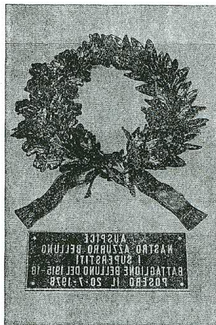
Corona e targa dei «veci» al Cippo Cantore

Il Sindaco di Cortina ci ha assicurato di avere interessato la Sezione locale del C.A.I., proprietario dell'immobile, onde venga predisposto un piano di lavori e li finanziamento.