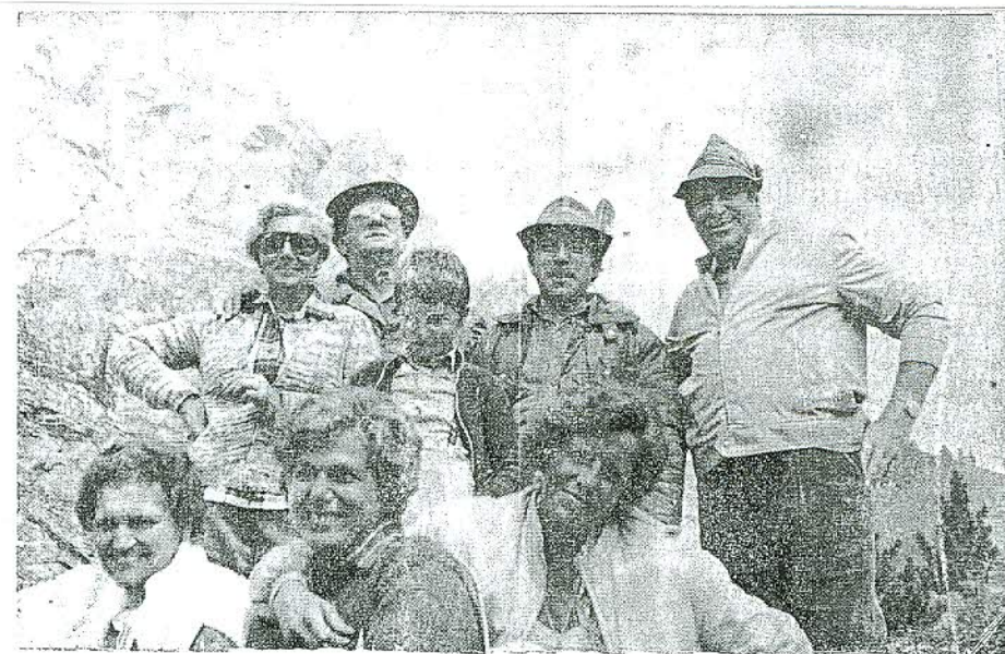
Gruppo al Rifugio Di Bona

in carne ed ossa, ancora così giovani, abbiano potuto aver ragione di quei colossi Dolomitici difesi dai valorosi e accaniti Bavaresi.