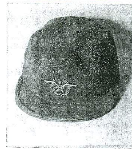
Il berretto da montagna del generale alpino