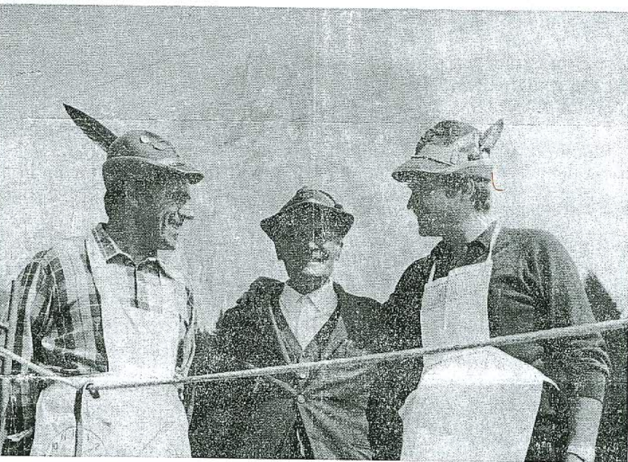
Il capogruppo e il vice «incatenati» al posto di ristoro di Palafavera