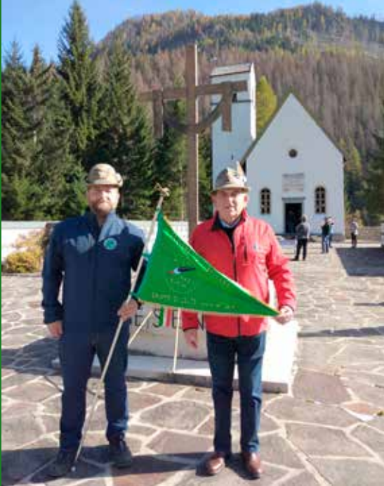
30 ottobre Pian di Salesei.