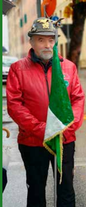
4 novembre Festa delle Forze Armate a Belluno.