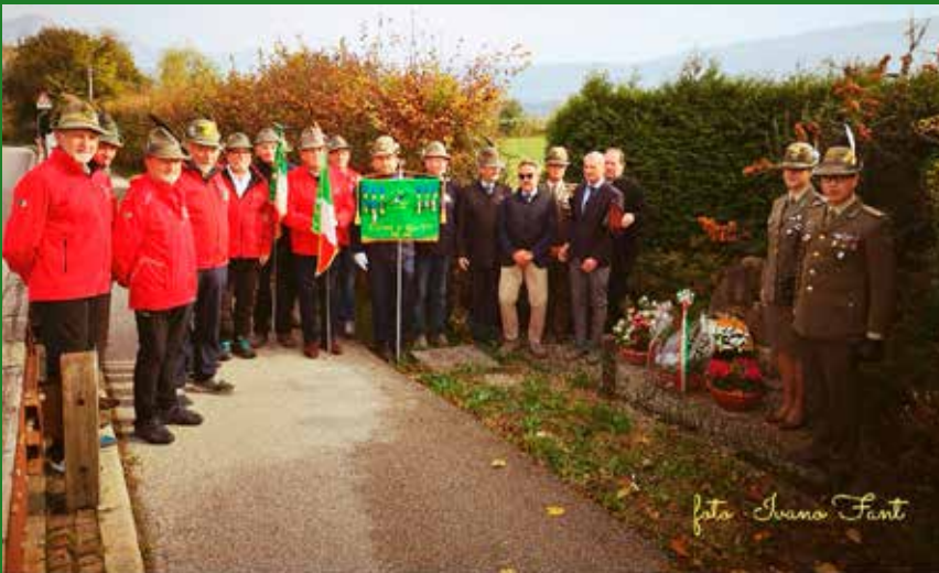
2 novembre omaggio al cippo di Giamosa.