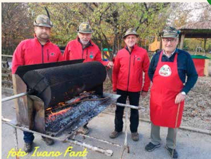
Foto a destra la castagnata a Mier, sotto alle scuole elementari di Giamosa.

E' oramai un appuntamento fisso la castagnata di San Martino con le scuole; all'inizio avevamo "l'appalto" alle elementari di Giamosa, poi la voce si è sparsa e alcuni anni fa abbiamo trovato un "nuovo cliente" all'asilo di Mier. Quest'anno ci siamo ulteriormente allargati e abbiamo acquisito anche l'Istituto Sperti in via Feltre. Queste seppur piccole collaborazioni, sono un modo per far conoscere gli Alpini al mondo della scuola con la speranza che il seme dei nostri valori un giorno riesca a germogliare nell'animo di questi ragazzi che oggi ci dimostrano sempre tanta gratitudine e riconoscenza.