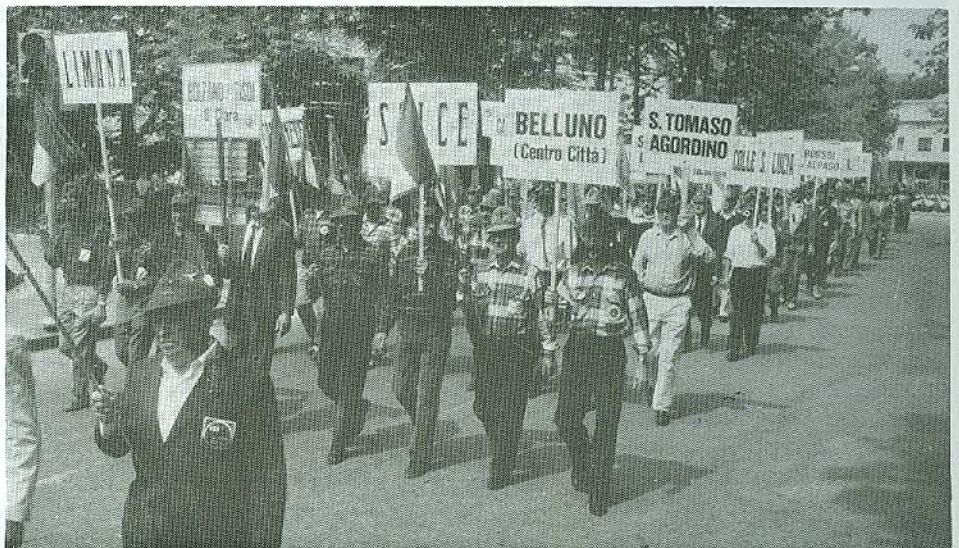
La lunga fila dei gagliardetti è accompagnata dai propri cartelli.