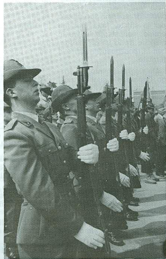
ONORE AI CADUTI PER IL 70° DELLA SEZIONE

Ma il gen. Rizzo a Tebelunodoiomi a Vicenza dichiarò: «stiamo adoperandoci a tutti i livelli per mantenere almeno alla consisten-