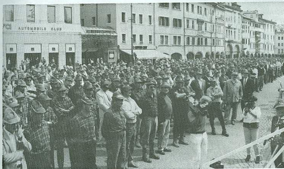
Gli alpini attenti e composti ascoltano i discorsi in Piazza dei Martiri .