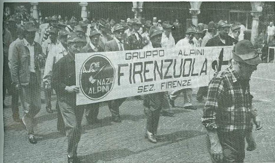
Erano presenti gli amici fiorentini... ci aspettano a settembre!