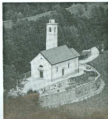
La chiesetta di S. Pietro

4° — GARNA-TORCH-S. PIETRO - sui 600 m. di quota, lunghezza circa km. 2,5 da percorrersi in 2 ore con accompagnatore. Si raggiunge da Puos d'Alpago.