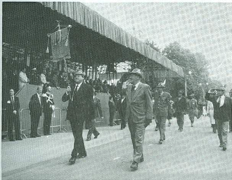
Davanti alla Tribuna d'onore

Il Presidente della Sezione, attraverso queste pagine, vuole porgere il suo grazie per la numerosa partecipazione (quasi tutti i Gruppi e un migliaio di presenze) all'Adunata Nazionale di Vicenza e rivolgere inoltre il suo plauso per la sfilata, fatta in buon ordine, nonostante le vie in qualche tratto un po' strette, con le conseguenti numerose fermate.