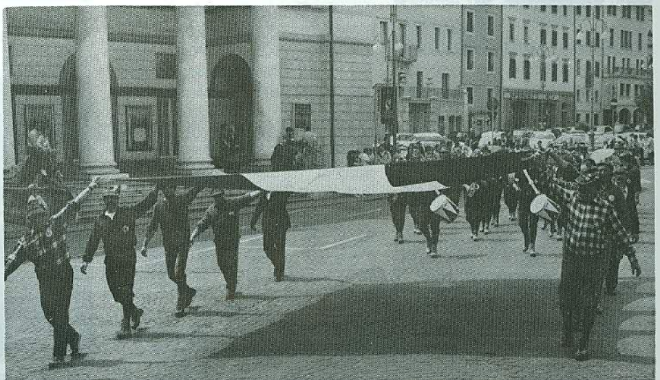
Il grande Tricolore davanti al teatro comunale e dietro la fanfara di Borsoi d'Alpago.