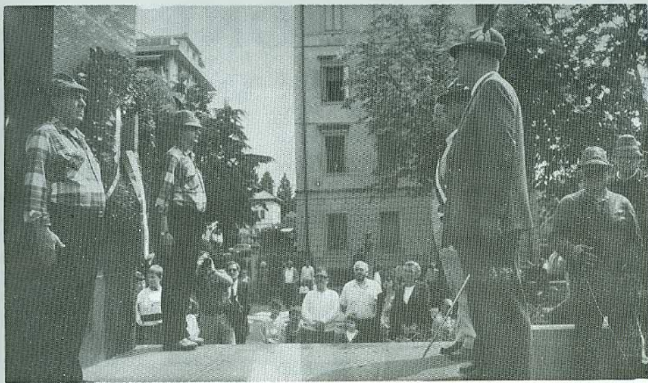
Atto primo: onore ai Caduti alla stele di viale Fantuzzi.