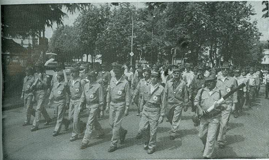
Il blocco degli alpini è preceduto dalla rappresentanza delle squadre antincendio di Limana, Trichiana e Mel.