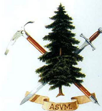
Asociación de Soldados Veteranos de Montaña