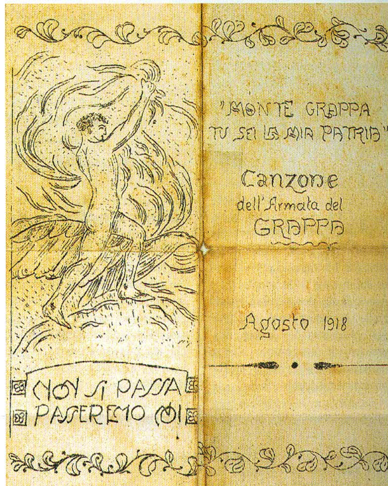
Originale della canzone consegnato ai soldati nel 1918