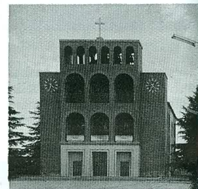
«IL TEMPIO DI CAGNACCO al Soldato Ignoto»

Con il patrocinio dell'U.N.I.R.R. è stato realizzato lo splendido volume storico-documentale sull'ARMIR e la Campagna di Russia