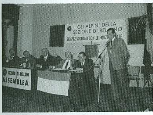
Il Presidente di Valdobbiadene