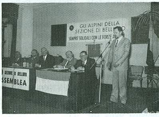
Il Presidente del Cadore