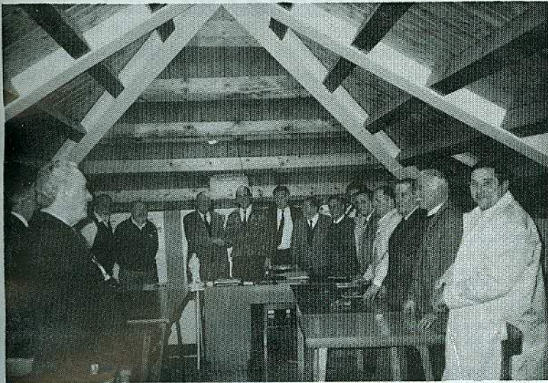
Il Consiglio Direttivo a Bribano nella nuova sede del Gruppo presente il Sindaco.

Presso la «Baita Alpina» del Gruppo di Limana a Valpiana, si è riunito il Consiglio Direttivo della Sezione di Belluno per trattare importanti argomenti, anche in vista dell'Adunata Nazionale di Vicenza.