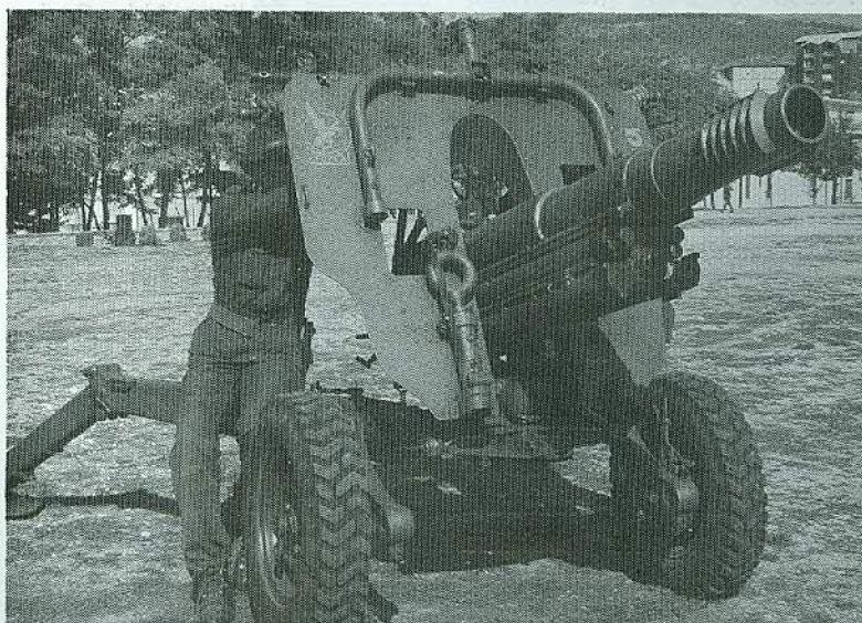
Un pezzo d'artiglieria da montagna