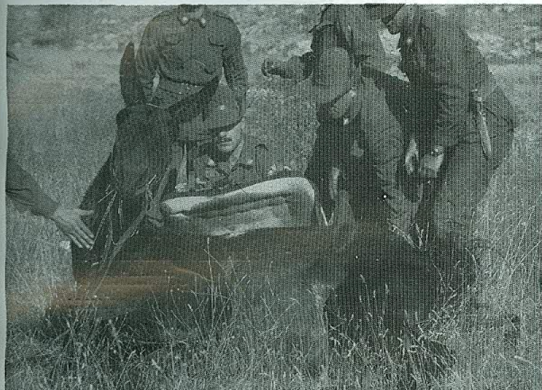
Ricordo col vecchio mulo

Moduli e modalità di iscrizione possono essere richiesti alla Segreteria della nostra Sezione di Via Carrera (tel. 0437/213944).