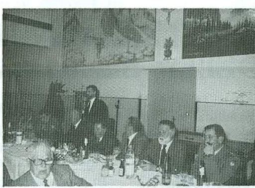
Il V. Presidente di Feltre