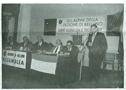
Il Presidente di Vittorio Veneto