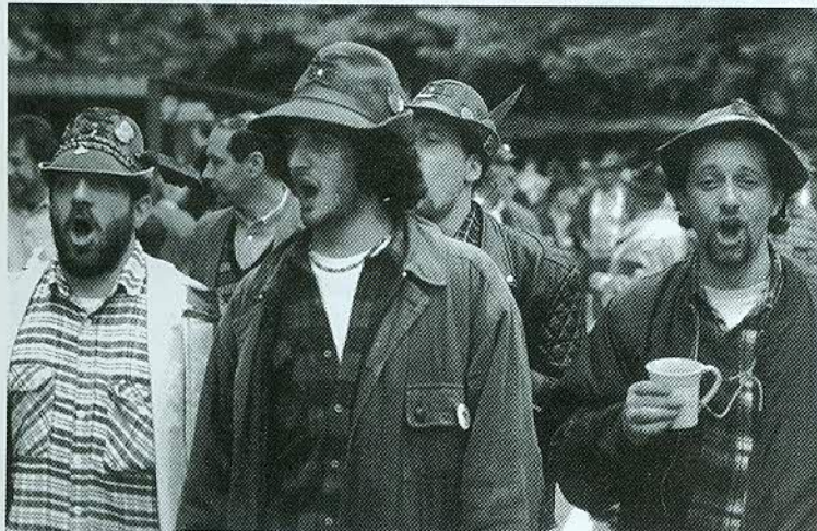
Questi cantano ancora...

TOTALE SOCI ORDINARI 7.552 "AMICI DEGLI ALPINI" 769