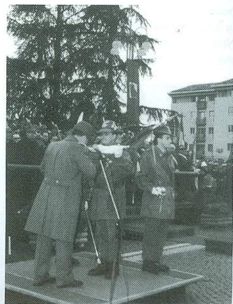
Così è finita...

(1995). Inoltre la Brigata è stata insignita dei premi "L'Agordino