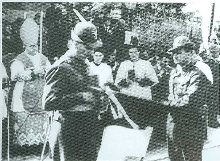
11 Aprile 1954 cominciò così...