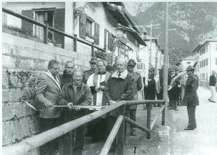
Termine di Cadore (Ospitale) inaugurazione Piazzola ai Caduti

A Termine di Cadore, con una semplice cerimonia, è stata inaugurata la nuova piazzola a ricordo dei Caduti di guerra. L'opera, realizzata dai volontari alpini del gruppo ANA di Ospitale con la collaborazione dell'Amministrazione