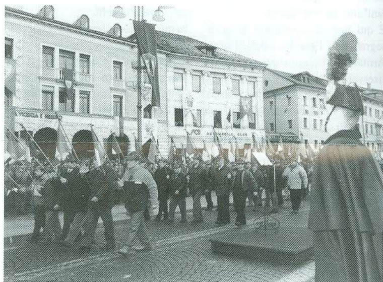
1 300 gagliardetti presenti

peraltro in virtù di numerosi impegni di ordine pubblico e di soccorso alle popolazioni colpite da calamità naturali: il disastro del Vaiont nel 1963, l'alluvione del 1966; i terremoti del Friuli nel 1976 e dell'Irpinia nel 1980; il cedimento dell'invaso minerario in Val Stava nel 1985; il servizio di ordine pubblico nel Bellunese e in Puglia nel 1991 in concomitanza con la guerra del Golfo, come prima era avvenuto in Alto Adige nel 1962-64; l'assistenza ai profughi croati e bosniaci in Cadore nel 1992 e nello stesso anno per la frana di Lamosano in Alpi; l'alluvione del novembre 1994 in Piemonte. Nell'ultimo triennio di vita, inoltre, la Brigata Alpina Cadore ha a più