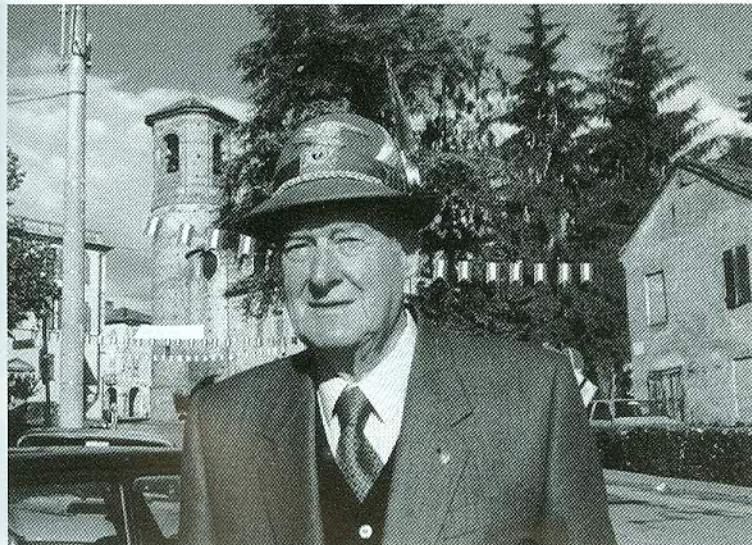
Il Presidente nella "sua" S. Damiano d'Asti