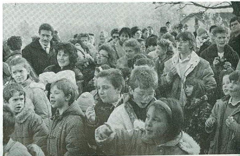
I bambini e i genitori salutano la Befana

Ci sembra che la manifestazione sia perfettamente riuscita e siamo contenti di aver regalato a grandi e piccoli un pomeriggio festoso, in allegria e con tante sorprese. E il cassiere, si fa per dire, piange... ma è anche lui contento.